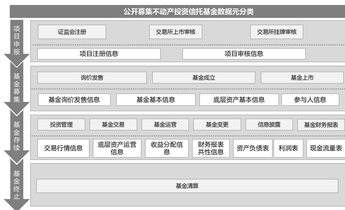
图 1 公开募集不动产投资信托基金数据元架构